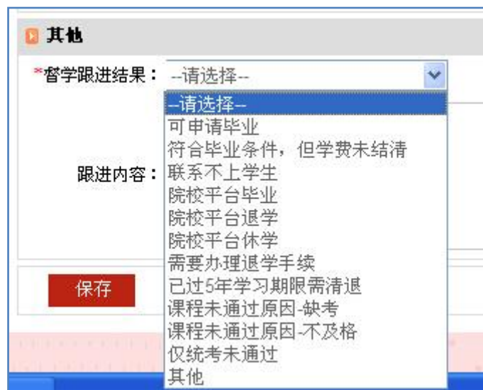
图 2 督学跟进