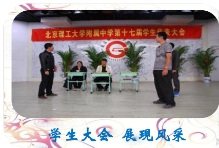
学生大会 展现风采