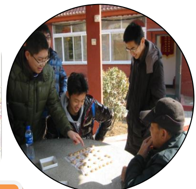
敬老院切磋棋艺 其乐融融