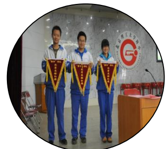
纪律评比 当仁不让