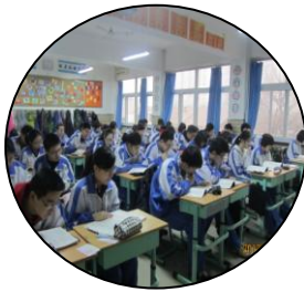
早读专注 书香弥漫

关于级旗：底色是为师的心愿，级徽是同学的结晶，师生相合，寄望经由全体的努力，我们2014届的师生于理工附中这一方天地间，汲取知德合一的营养，体验彼此生命蓬勃成长的喜悦和幸福。