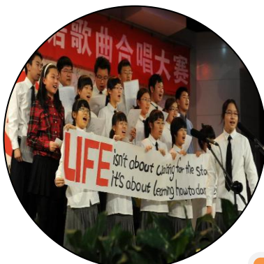
英语歌曲合唱 大赛激情洋溢