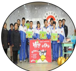
化学竞赛 争优创先