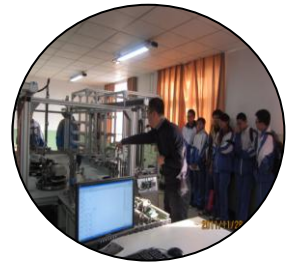
理工风采 大学体验