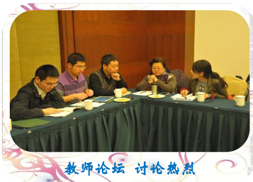
教师论坛 讨论热烈